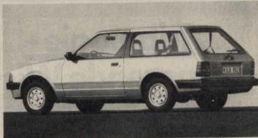
Der Kombi (Turnier) ist nur 3türlich lieferbar und kostet zwischen 12 300 (Basis) und 14 880 DM (GL).

klein geratenen Lenkrad liegt. Kenner des alten Escort RS werden sich dagegen gleich wieder wie zu Hause fühlen: Der XR3 hat die etwas steife Knackigkeit des RS behalten, ist aber mit seinem serienmäßigen Bilstein-Gasdruckstoßdämpfer-