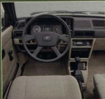
Zweifarbige Ghia-Armaturentafel mit serienmäßigem Drehzahlmesser, 4-Speichen-Lenkrad auch in der GL-Version.