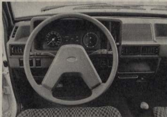
Einheitlich: 220 km/h-Tacho für alle Modelle. Unsinnig: eine dritte Lenkrad-Variante (hier für Basis und L).