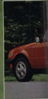
Escort XR3: die großen Heckspoiler bringen soll.