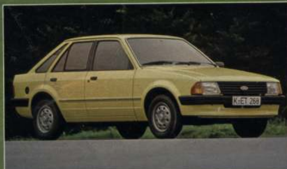
In der 4türigen Version, hier ein »L«, hat der Escort ein drittes Seitenfenster und wirkt gestreckter als der Zweitürer. Der Seitenstreifen ist nur Optik und erst ab GL eine echte Schutzleiste.