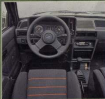
XR3-Interieur mit gestreiften, gut geformten Sportsitzen und einem dick gepolsterten, sehr kleinen Lenkrad.