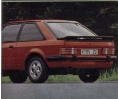
sportliche Variante, die u. a. mit einem ler noch bessere Aerodynamik (Cw 0,375) Die Leichtmetallfelgen sind serienmäßig.